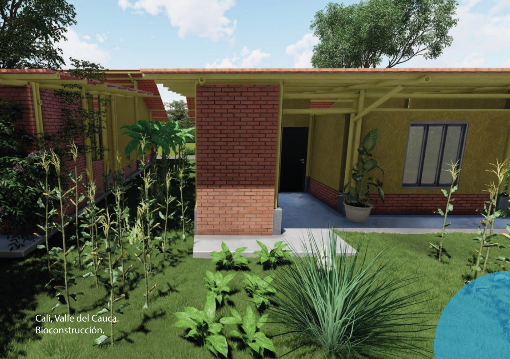
Cali, Valle del Cauca. Bioconstrucción.

Para la Escuela Taller de Cali, estas acciones se han dado gracias al apoyo de entidades financiadoras como la Unión Europea y el Ministerio de las Culturas, los saberes y las artes; sobre todo al compromiso del grupo de mujeres y hombres que han creído en la importancia de seguir apostándole a la construcción de la paz en el país, en este caso, las y los firmantes comprometidos son actores clave, que han propiciado la construcción de nuevas propuestas para el hacer y pensar el desarrollo local, es por ello, que la Escuela Taller de Cali, seguirá siendo un aliado para los procesos que busquen mejorar las condiciones de convivencia en el país, lo que constituye un aporte para avanzar hacia la construcción de la paz.