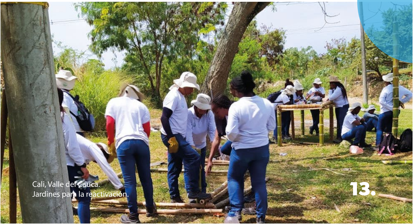
Cali, Valle del Cauca. Jardines para la reactivación.