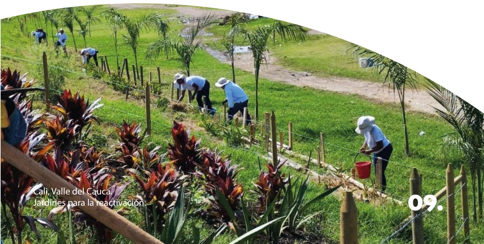
Cali, Valle del Cauca. Jardines para la reactivación.

Esto permitió que las acciones desde el patrimonio, generaran como consecuencia la reinención de la Escuela Taller de Cali, en este caso, la jardinería como una expresión de las prácticas tradicionales en muchos casos domésticas, lo que sirvió de base para la creación de un programa de formación que ha retomado de ello, esos saberes que son fundamentales para desarrollar la sensibilidad que implica el oficio de la jardinería. El programa se ha volcado