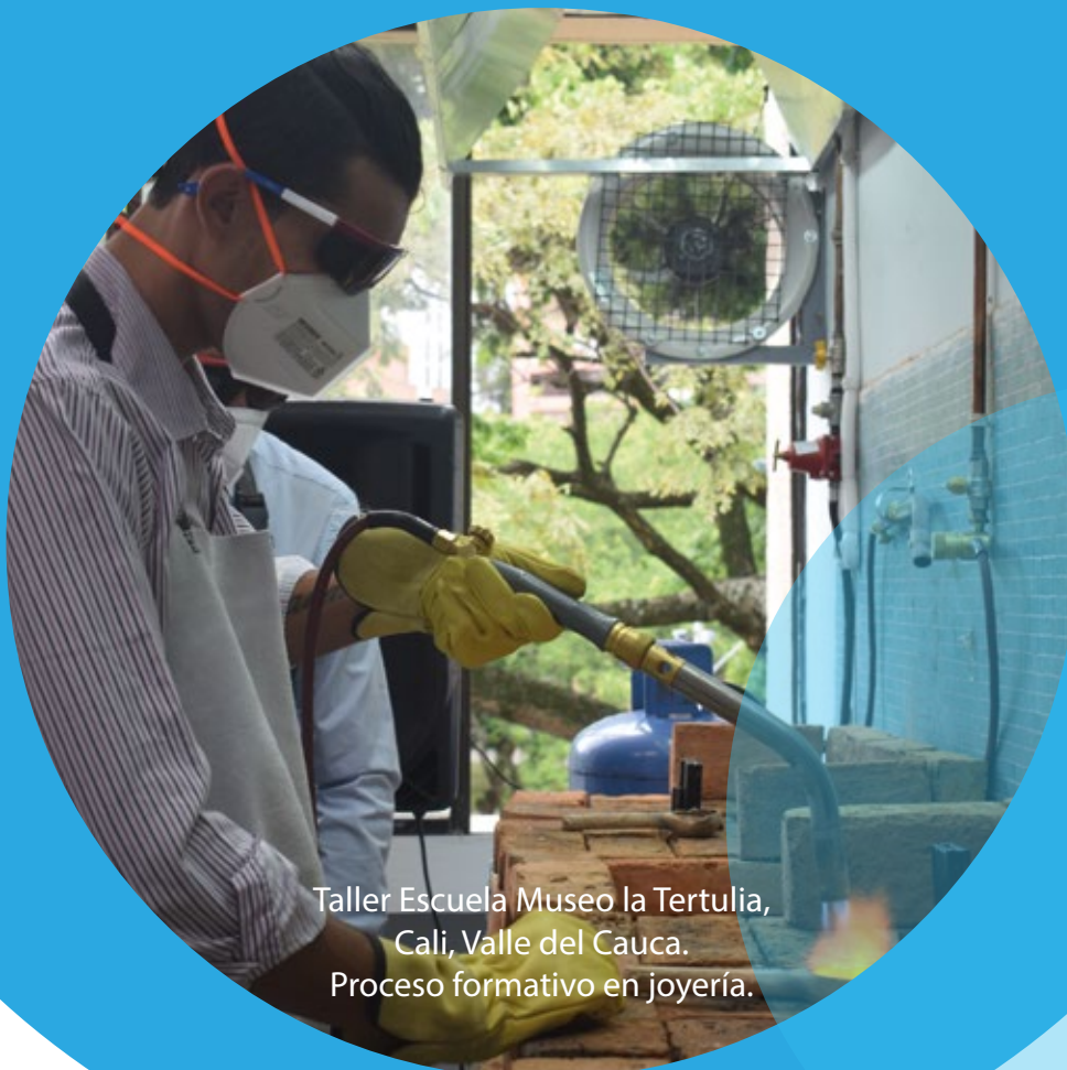
Taller Escuela Museo la Tertulia, Cali, Valle del Cauca. Proceso formativo en joyería.

Este informe luego de las acciones producidas y gestionadas en el año 2022. Sirve también para mirar con perspectiva crítica aquello que ha sido positivo y lo que no, sobre todo porque es prioritario reconocer que no todo lo hecho a pesar de lo retador y complejo, es siempre negativo, y no siempre lo nuevo por la novedad en sí mismo es positivo por definición. Las Escuelas Taller de Colombia son lo que se ha edificado con los equipos en cada territorio, y son lo que construyen en el presente.