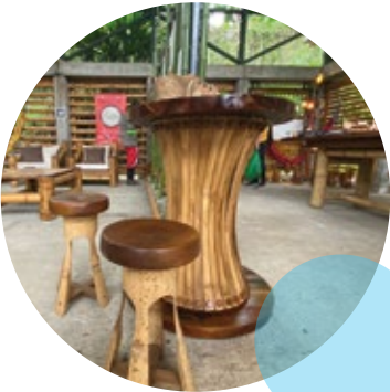
Artesanías en guadua