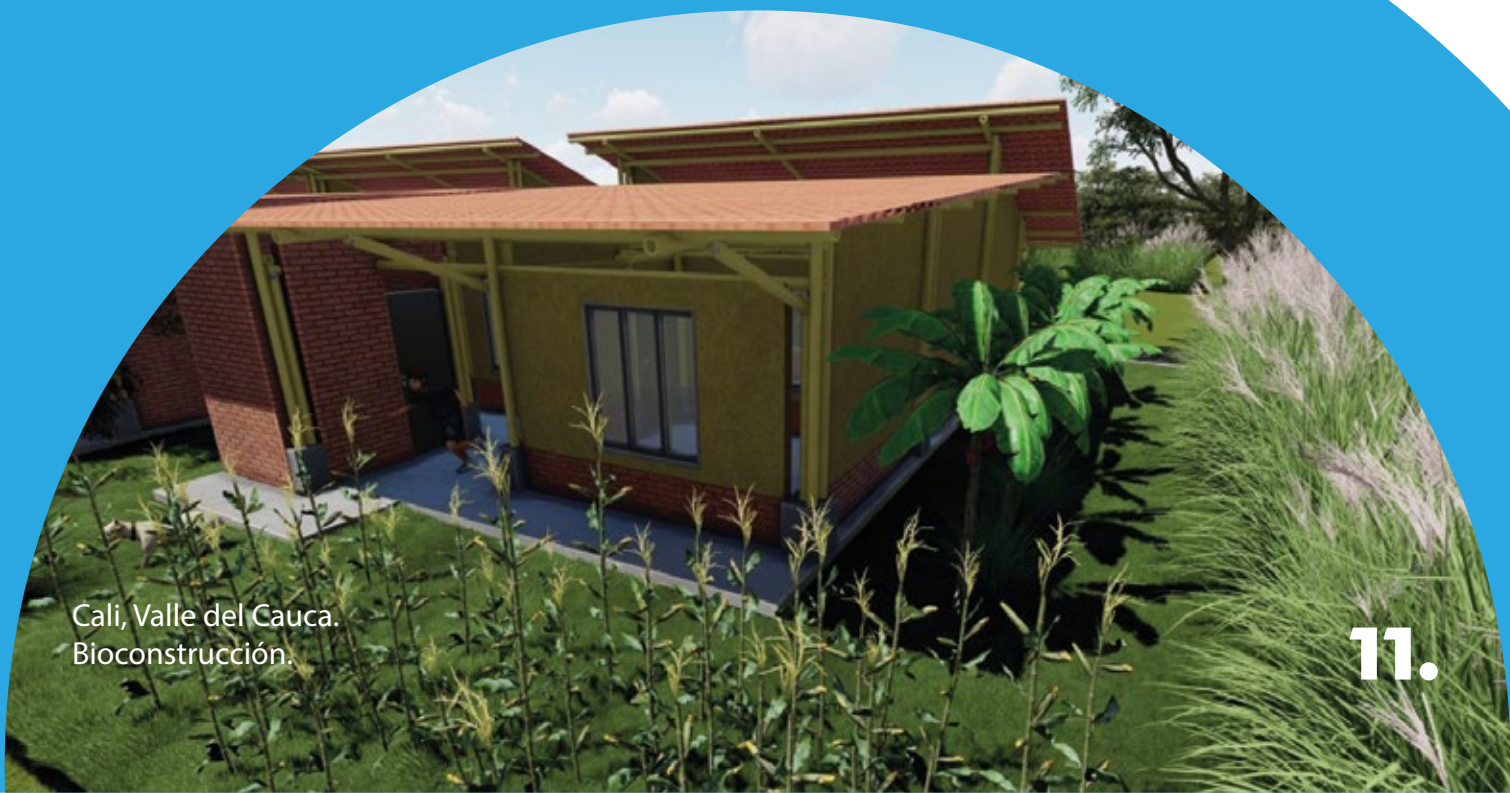
Cali, Valle del Cauca. Bioconstrucción.

Otro elemento a resaltar del proyecto, es el que tiene que ver con la formación en Bioconstrucción, que cuenta con un resultado importante, en este sentido, debido a que luego de los procesos formativos, las personas participantes de este taller avanzaron con el equipo de maestros y docentes en el diseño de su propio modelo de vivienda de interés cultural, que está inspirada en los diferentes orígenes regionales de las personas vinculadas al proceso de paz, además de las reflexiones sobre las condiciones de vida a la que aspiran y que se pueda seguir conectando con los territorios de donde provienen cada uno de ellos.