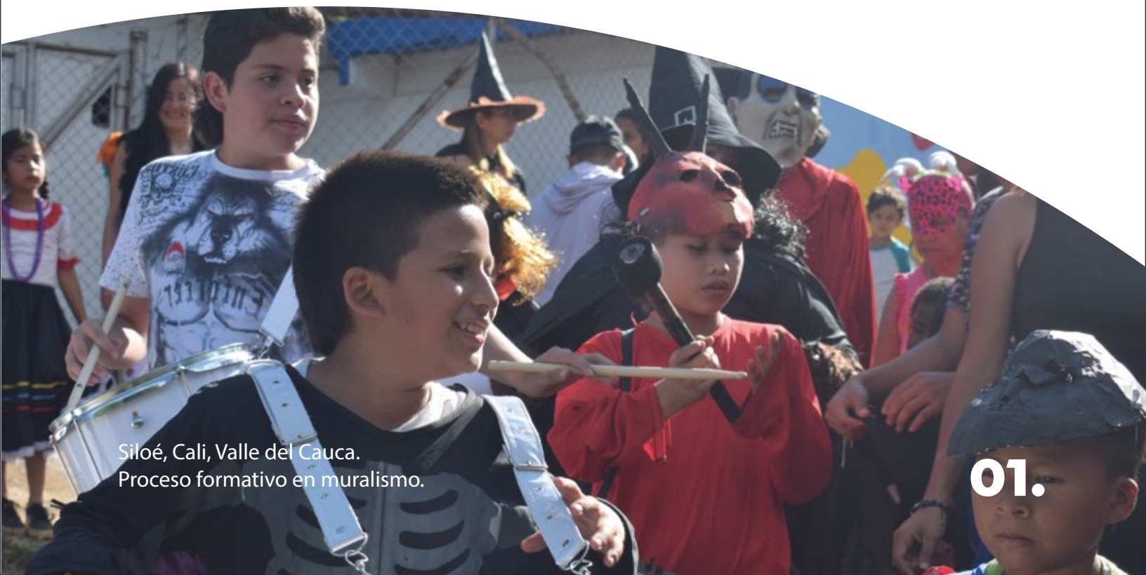
Siloé, Cali, Valle del Cauca. Proceso formativo en muralismo.

La culminación del año 2022, resulta especialmente significativa para la Fundación Escuela Taller de Cali, porque implicó necesariamente la reflexión desde el punto cero, donde comenzó el caminar de la entidad hasta el momento en que se encuentra actualmente, aunque resulte redundante mencionarlo, tiene un valor especial decir, que la Escuela Taller hoy no es la misma desde su creación en el año 2017; por el crecimiento en términos cuantitativos y cualitativos, es decir, desde la mayor cantidad de beneficiarios, los nuevos oficios del campo de la cultura en los que se ha trabajado, hasta los municipios donde se han generado acciones para gestión de lo patrimonial.