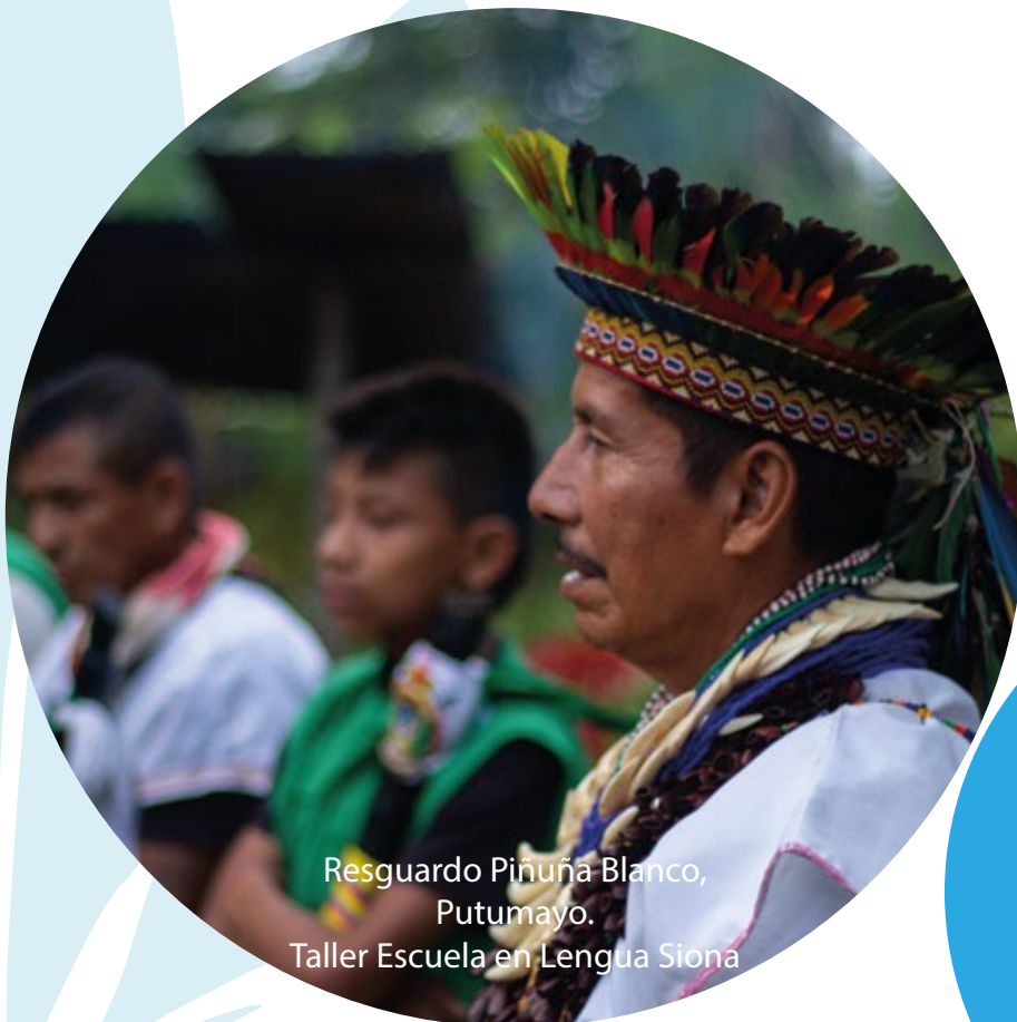
Resguardo Piñuña Blanco, Putumayo. Taller Escuela en Lengua Siona

En conclusión, el año 2022, es un punto de inflexión que ha hecho necesario reorientar misionalmente el trabajo de la institución, también dar los pasos necesarios para consolidar los aprendizajes producidos en la práctica, ajustes que hacen parte de la nueva perspectiva estratégica que se ha construido para la Fundación Escuela Taller de Cali; en ellos se refleja la importancia de otros sectores como el de la moda en el campo de los oficios, donde las prácticas artesanales son claves para la puesta en valor de los saberes de los maestros y maestras, es un aspecto fundamental para la generación de valor, agregados sobre productos y servicios, y también sobre otros campos de trabajo donde ya ha habido una experiencia importante en la ciudad; sin que lo anterior quiera decir, que renunciamos a la jardinería como el núcleo fuerte del accionar de la Escuela Taller, todo lo contrario, lo que se quiere es continuar profundizando en estas dimensiones para lograr los impactos que se han venido produciendo históricamente, que tiene como principal actor a las y los aprendices, a maestros y maestras de los oficios artesanales.