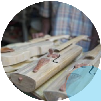
Lutería (violines caucanos)

Entre los diversos oficios que se trabajaron durante todo este trayecto, se pueden mencionar los siguientes: