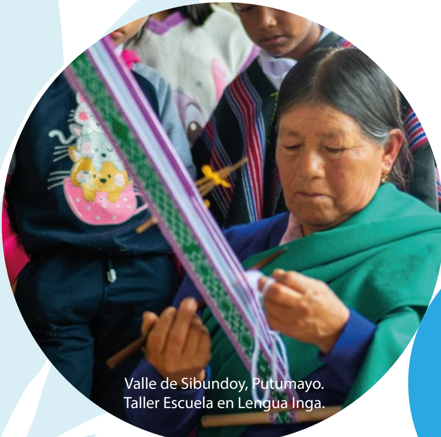
Valle de Sibundoy, Putumayo. Taller Escuela en Lengua Inga.

Esperamos que el 2023, se convierta en la oportunidad de contribuir como actores protagónicos en la transformación de la ciudad y la región, así como seguir aportando para que el patrimonio cultural sea un espacio social para el desarrollo.