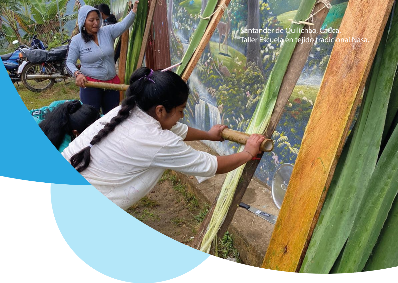
Santander de Quilichao, Cauca. Taller Escuela en tejido tradicional Nasa.

a la ciudad, en este caso, se han intervenido cerca de 20 espacios públicos de Cali, estos ubicados especialmente en el oriente de la ciudad, lo que significa que esta es una Escuela Taller hecha para andar la calle.