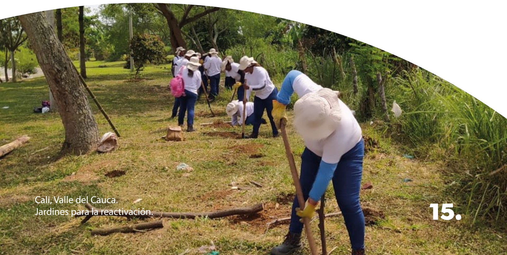
Cali, Valle del Cauca. Jardines para la reactivación.

Cuando se menciona que la Cali ha sido una Escuela Taller, es porque la Fundación Escuela Taller de Cali, ha hecho de la ciudad hasta donde le ha sido posible, la configuración de manera flexible de ambientes de aprendizaje, donde los componentes prácticos del hacer, dejan en la comunidad evidencias tangibles de sus propias transformaciones; cada jardín en Cali que ha sido realizado con la participación de la Escuela Taller, es equivalente a un salón de clase, un salón de puertas abiertas para los que tienen la necesidad de contar con espacios abiertos y debidamente cualificados.